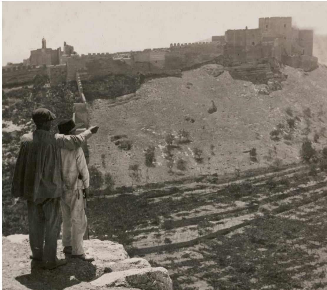
Fotografía de una pareja contemplando la Alcazaba de Almería (1908).

En la desconocida fotografía de 1908 encontrada en el archivo de la 'Library of Congress' de Estados Unidos se puede ver a una pareja que, encaramada a la Muralla de Jayrán, contempla el lienzo norte de la Alcazaba. Uno de ellos, abusando de la confianza del otro, señala el horizonte mientras apoya su codo sobre el hombro de su acompañante. Lo que no saben ninguno de los dos es que sesenta años después, justo a sus espaldas, estuvo a punto de producirse otro abuso de con-